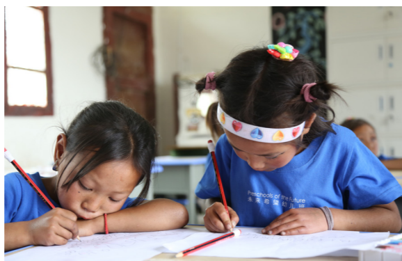
在幼儿班学习关于科学、自然、艺术等不同的知识