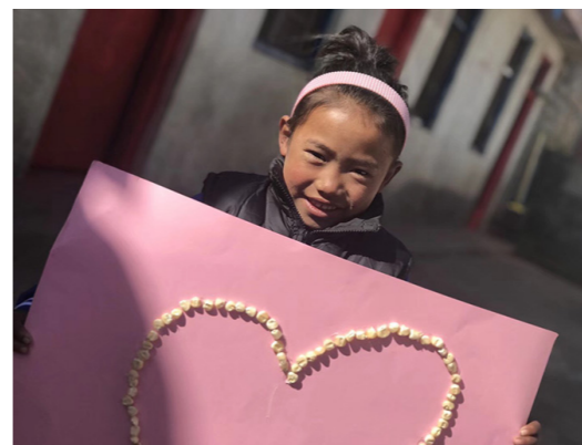
利用粮食创作贴画