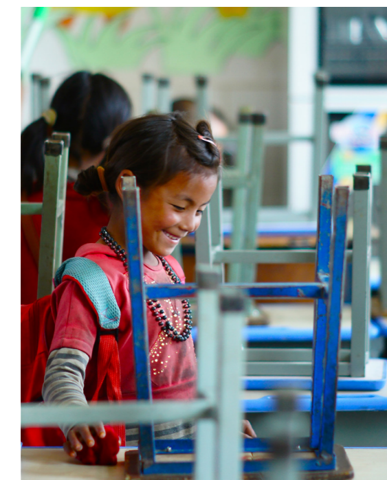
在幼儿班养成爱劳动的好习惯