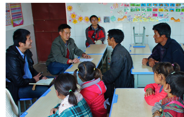
召开家长委员会会议