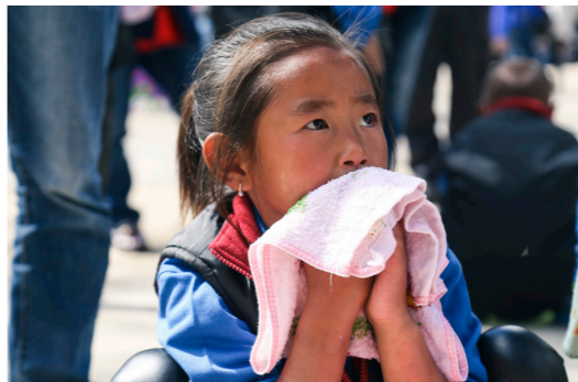
在幼儿班逐渐养成良好的卫生习惯