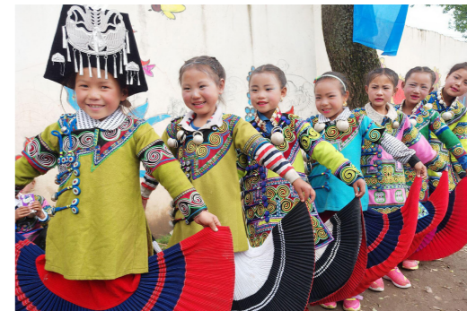
月度主题活动 - 六一节演出