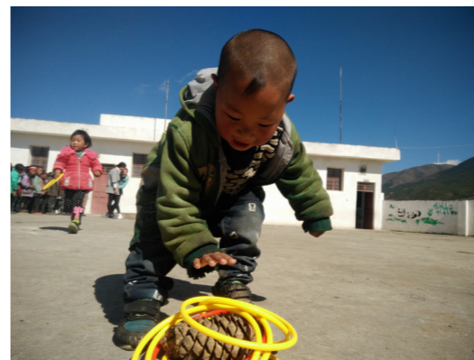
户外活动有益于孩子体格的发展